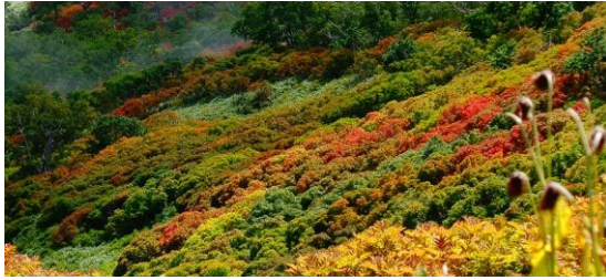
黒岳九合目マネキ岩下沢筋の紅葉