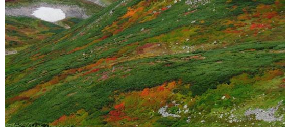
凌雲岳裾野の紅葉

【開花】【七合目～雲ノ平】チシマヒョウタンボク実・ミヤマアキノキリンソウ・ヤマハハコ・ウメバチソウ・ダイゼツトリカブト・ミヤマセンキュウ等 お花もそろそろ終花の様相です。