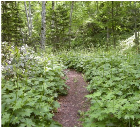
クマゲラ広場のエゾノレイジンソウがもうすぐ見頃を迎えます