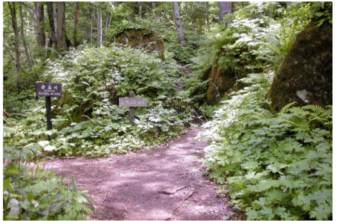
木漏れ日が爽やかに差し込む散策路