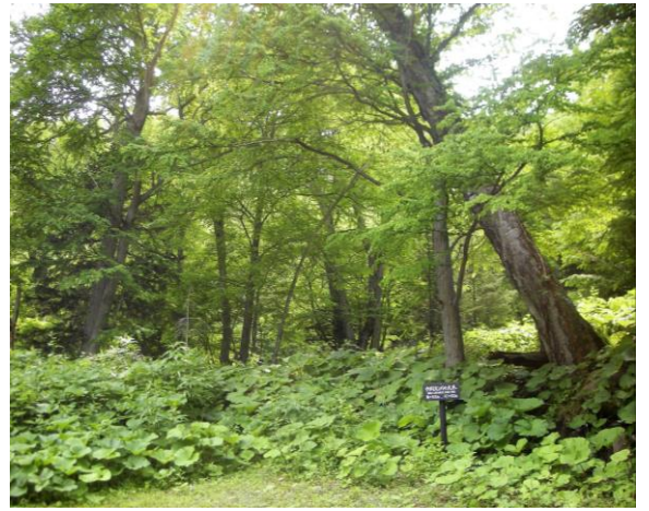
緑が濃くなった森