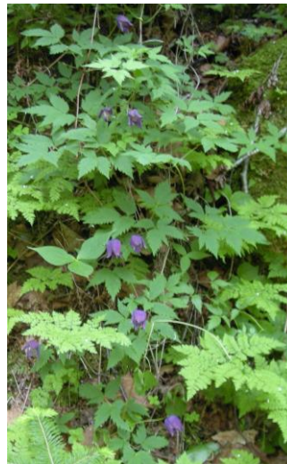
ミヤマハンショウヅル