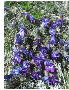
エゾオヤマノエンドウ