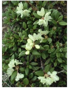
キバナシャクナゲ