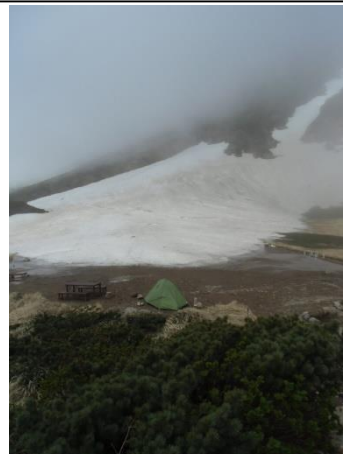
⑦白雲小屋テント場