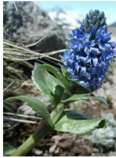
ホソバウルップソウ