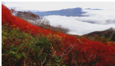
七合目周辺: 点々とウラジロナナカマド