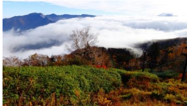
早朝雲海が発生しました