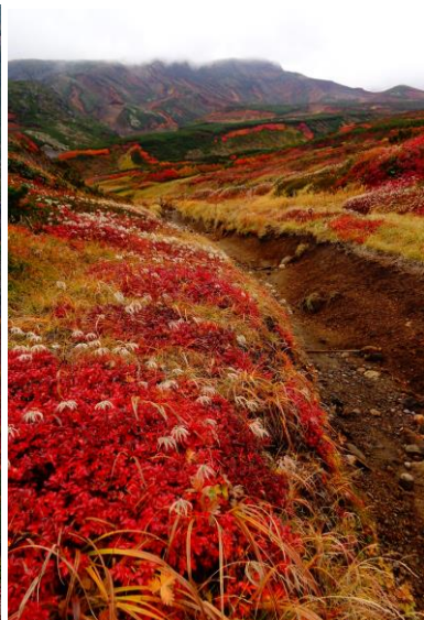
④黒岳石室周辺(赤石川方面)

①枯れかけが多いが、ウラジロナナカマドが点々と色付く。②場所によっては橙色のウラジロナナカマドも出始める。③烏帽子岳周辺、さらに色濃くなり見頃の状態。④草紅葉は見頃を保っている。遠目に見るウラジロナナカマドは見頃の状態だが、枯れかけも目立ってきた。*黒岳東斜面の紅葉は、そろそろ終盤の様相です。この時期は、軽装での登山はかなりのリスクがあります。装備を万全に。