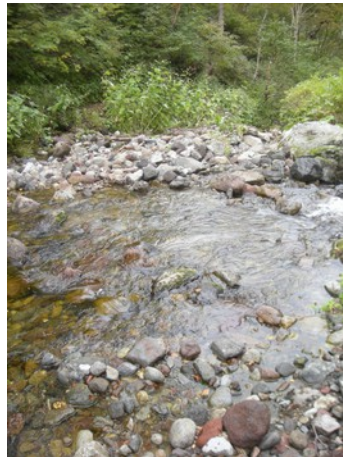
②村雨の滝上部渡渉点