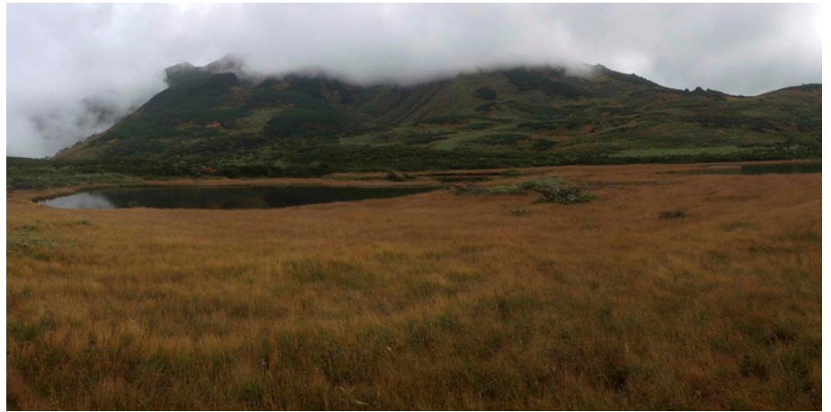
五ノ沼周辺の草紅葉