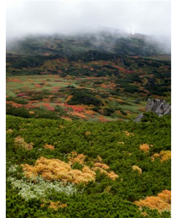
⑧当麻乗越から裾合平方面