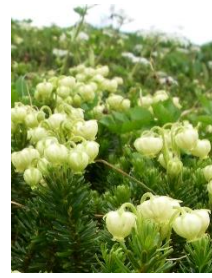
アオノツガザクラ