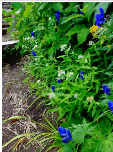
②黒岳八合目～九合目周辺