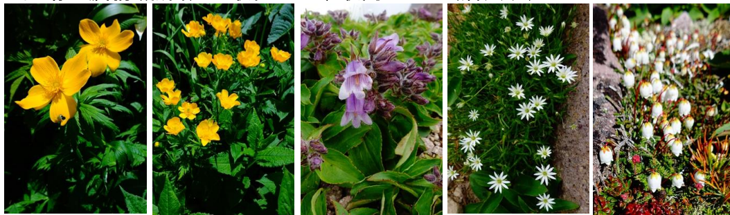
チシマノキンバイソウ ミヤマキンポウゲ イワブクロ エゾイワツメクサ イワヒゲ

【残雪状況】七合目標柱を過ぎて20・5m、八合目標柱を過ぎて8・8・8mの雪渓。【開花状況】【七合目】エゾイチゲ 【八合目～石室】エゾイワハタザオ・エゾノハクサンイチゲ・ミヤマキンポウゲ・ジンヨウキスミレ・チシマノキンバイソウ・ハクサンチドリ・クロユリ・キバナノコマノツメ・カラマツソウ・チシマヒョウタンボク・トカチフウロ・エゾイワツメクサ・イワギキョウ・タカネオミナエン・ミヤマキンバイ・キバナシャクナゲ・メアカンキンバイ・イワウメ・エゾコザクラ・コマクサ・ジムカデ・イワブクロ・ミネズオウ・エゾツガザクラ