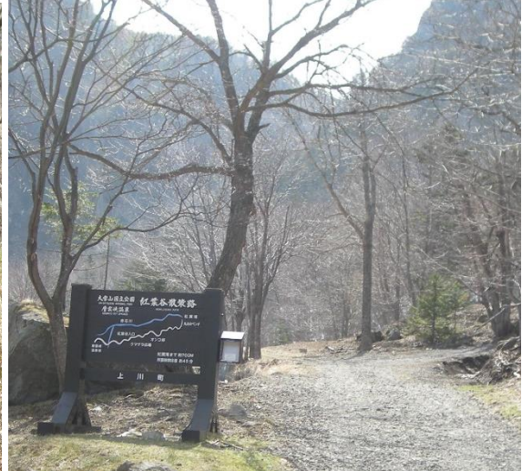
入口付近の雪はありません