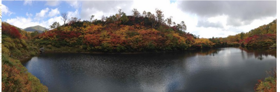
b.紅葉最盛期の式部沼