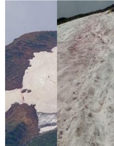
⑧北鎮岳分岐下雪溪

⑤部分的に「エゾツガザクラ」「チングルマ」「エゾコザクラ」等は開花しているが、今年の不安定な気象の影響で、萎れかけが目立つ。遠目に見る「エゾコザクラ」「チングルマ」「エゾツガザクラ」は見頃。⑥水量は若干多いが、渡渉可能。⑦赤石川方面同様に萎れかけが目立つ。開花しきれず「茶枯れた」チングルマが目立つ。群生という意味では「今年は弱い」という状況。⑧概算で約10mの雪溪。急斜面に付いていることで上下山ともにまだ注意が必要。*本日も所々で「霜柱」が見られた。夜半から早朝にかけて「冷え込んでいる」様子。4月からの不安定な天候と、7月に入ってからの低温等の影響を受けた植物は、少なからず萎れかけが目立つ状況。特に、今年の「雲ノ平」は遠目でみる植物は見頃の物もだが、全般的に「群生」という意味では「弱い」年となりそうな様相です。