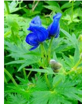
ダイセツトリカブト