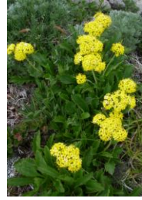
タカネオミナエシ