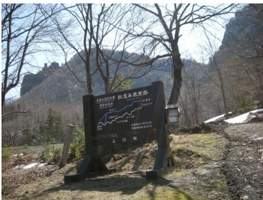
駐車場付近の看板