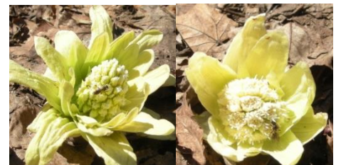
フキノトウの雌花 (左) 雄花 (右) には早速、昆虫が 来ていました