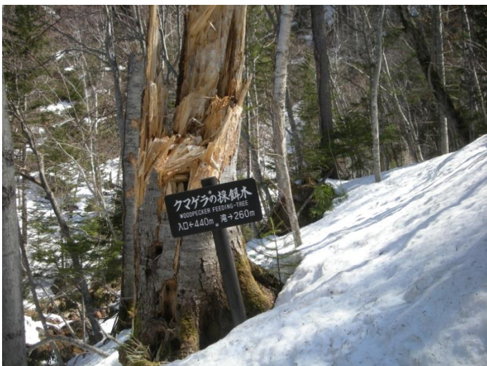
ここからは急斜面が続きます