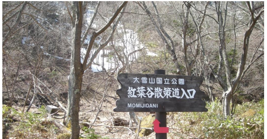
入口付近の雪は融けました

赤石川の両岸は柱状節理となっており、この崖をまぢかに見ることができますが、まだ雪があり不明瞭です。踏み抜きや急斜面もありポールが必要です。ミソサザイとルリビタキが美声を響かせ、あちこちからカラ類の声も聞こえ賑やかでした。付近の水たまりには、エゾアカガエルが鳴き交わして集まり産卵していました。