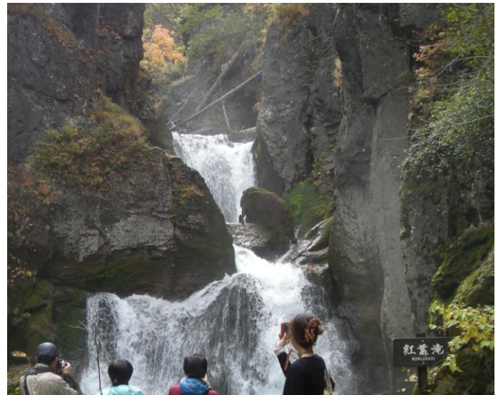
紅葉滝の前は撮影の人が途切れません