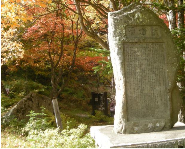
病院の取り壊しにより分かりやすくなった「記念碑」