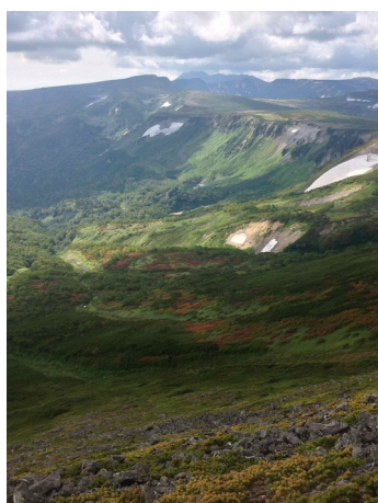
⑤岩塊斜面より南沢俯瞰

樹林帯上部でもウラジロナナカマドが色づいてきた①。第一花畑は斜面上部のウラジロナナカマドが色づいている②③。第二花畑は全体的に色が変わってきた④。南沢の通称「タスキの紅葉」斜面はウラジロナナカマドが全体的に見頃期に入ってきた⑤⑥。板垣分岐周辺のウラシマツツジの群落は最盛期の色づき状態⑦⑧。