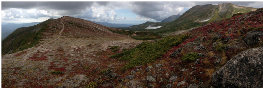
板垣分岐付近のウラシマツツジ群落