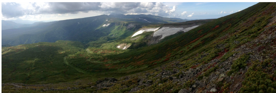
岩塊斜面上部より南沢(タスキの紅葉斜面)俯瞰