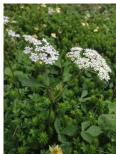
ハクサンボウフウ