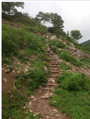
⑤エイコの沢ガレ場

緑岳山頂～板垣分岐：クモイリンドウ↑イワブクロ・ウスユキトウヒレン・チシマギキョウ終