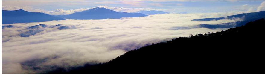
早朝見事な雲海が現れました。左から、平山・屏風岳・武利岳・武華岳