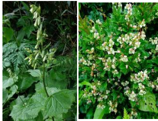
コモチミミコウモリ ミヤマホツツジ