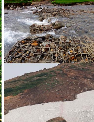
⑧赤石川・北鎮岳分岐下

⑤全体的には綿毛群落状態。その中に、ミヤマアキノキリンソウやミヤマリンドウ等が混じる。⑥⑦雪どけ場から、エゾコザクラ・ミヤマキンバイ・エゾツガザクラ・アオノツガザクラ・チングルマ等が小群落形成。⑧本日は登山靴の上部まで水。水流もやや強くストック・スパッツは必須。バランスをとって慎重に渡って下さい。北鎮岳分岐下雪渓は約10mの雪渓。悪天時要注意。*朝晩は少し寒さを感じます。歩行時は問題ありませんが、そろそろ防寒対策要。*雨の影響で、登山道悪路目立ちます。慎重な歩行を。