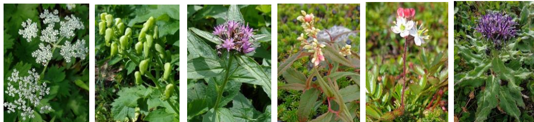
ハクサンボウフウ エゾレイジンソウ ナガバキタアザミ ヒメイワタデ チシマツガザクラ ウスユキトウヒレン