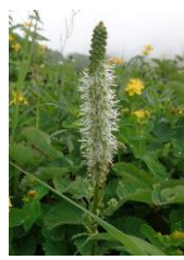
タカネウウチソウ