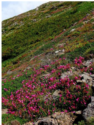
②黒岳頂上直下～ボン黒岳