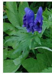
ダイセツトリカブト