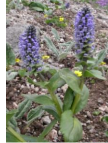
ホソバウルップソウ