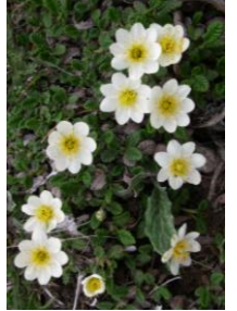
チョウノスケソウ