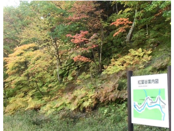
駐車場付近の紅葉 (下)