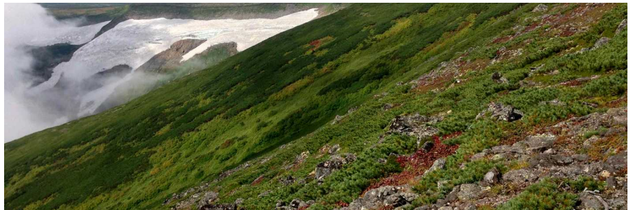
岩塊斜面上部から「タスキの紅葉」斜面と高根ヶ原方面(左後方)を望む