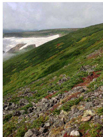
⑦岩塊斜面上部より高根ヶ原方面