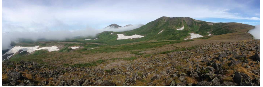
緑岳山頂から高根ヶ原(左)旭岳(中央)緑岳(右)を望む