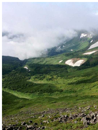
⑥岩塊斜面上部より俯瞰