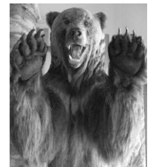
センターの剥製です。