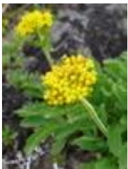
タカネオミナエシ