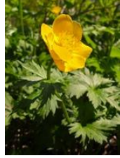
チシマノキンバイソウ