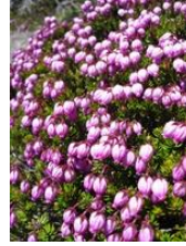
エゾノツガザクラ