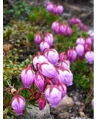
6/13 から新たに「ジヨウキスミレ」「エゾノハクサンイチゲ」～九合 「チングルマ」「エゾノツガザクラ」～ポン黒 開花