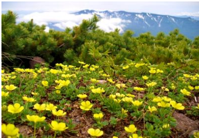
⑦ 黒岳山頂(後方ニセイカウシュツペ山)