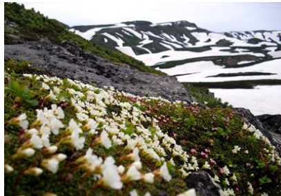
⑧ ポン黒岳(後方北海岳)