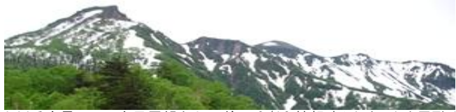
① 黒岳～上川岳全景 : 五合目展望台より 前回 6/13 情報時からゆっくりと雪融けが進んでいます。