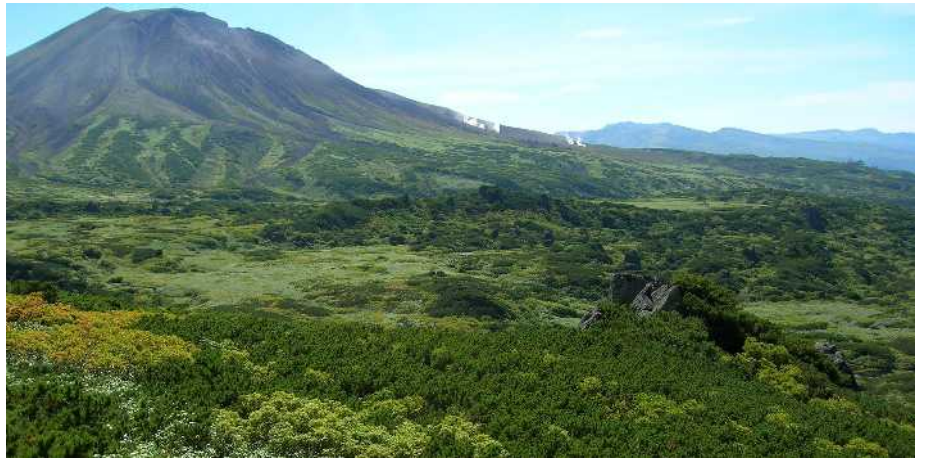
当麻乗越から旭岳方面を見る