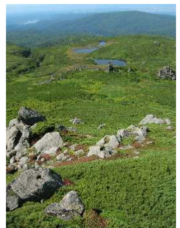
⑧当麻乗越から沼ノ平俯瞰