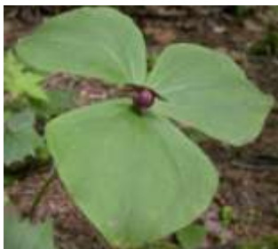
ミヤマエンレイソウの実