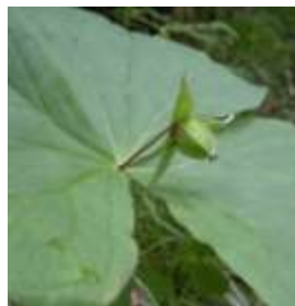
エンレイソウの実