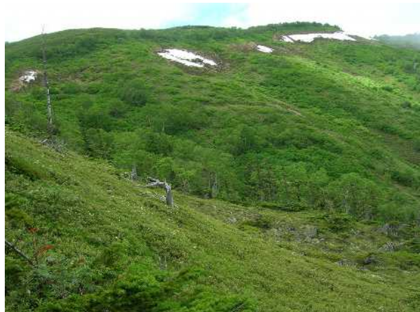
①第一花園斜面全景

小泉平：エゾハハコヨモギ○エゾタカネツメクサ○ミヤマアズマギク↑サマニヨモギ↑チシマキンレイカ↑ エゾツツジ↑イワブクロ↑チョウノスケソウ↓タカネスミレ↓キバナシオガマ↓