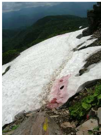
⑥エイコノ沢ガレ場