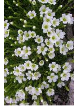
エゾタカネツメクサ