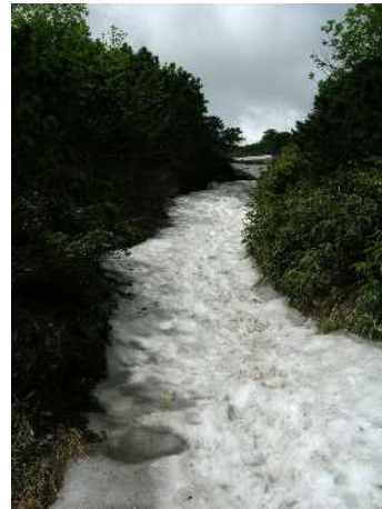
③第一・第二花畑中間部