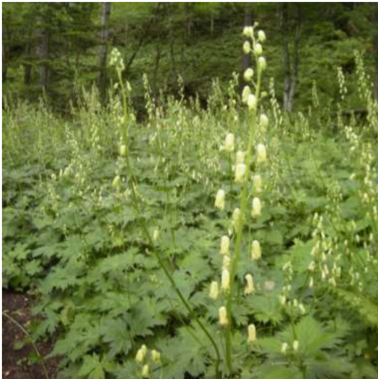
クマゲラ広場のエゾノレイジンソウ群落が見事です