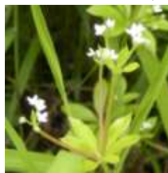
オククルマムグラ