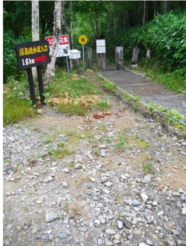
② 浮島湿原散策道入り口