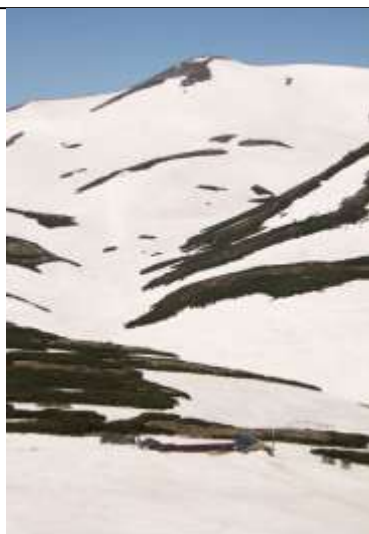
⑦ ポン黒から石室周辺