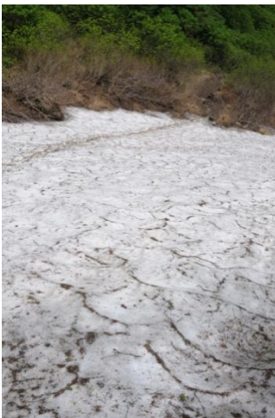
①第一花園看板手前

【第1花園】アオノツガザクラ、ウコンウツギ〇、チングルマ↑【コマクサ平】コマクサ↓、チシマツガザクラ〇、イワブクロ〇【第4雪渓】チングルマ〇、エゾノツガザクラ↑、エゾコザクラ〇【山頂】イワブクロ、チシマギキョウ↓、チシマツガザクラ↓