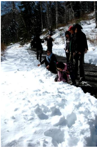
①黒岳5合目駅舎周辺