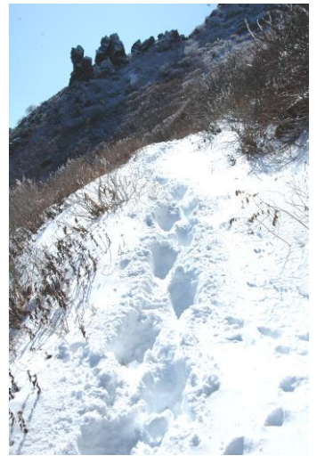
④黒岳9合目標柱周辺

①黒岳 5 合目周辺では 15～20 cm 程の雪が積もる。②黒岳 7 合目周辺の積雪は 50 cm ほどで登山道は至る所で踏み抜きがあり非常に危険。③黒岳 8 合目周辺は 50～60 cm 程が積もり歩行困難なほど深くなる。④黒岳 9 合目標柱周辺を過ぎたあたりから積雪が 80 cm を越え、場所によっては腰まで雪に埋まるような所もあり通常なら登山できない状態。