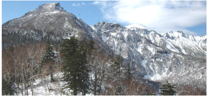
黒岳 5 合目展望台から見た表大雪山