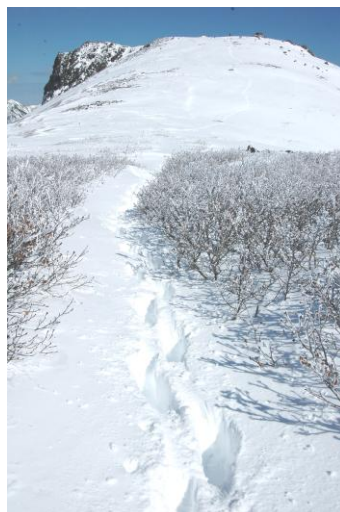
⑥黒岳山頂～ポン黒間