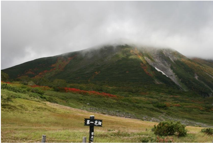
① 第一花畑より緑岳

【第二花畑】 チングルマ↓、ミヤマキンバイ〇、アオノツガザクラ↓、ミヤマリンドウ〇、ヨツバシオガマ↓、