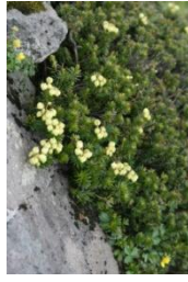
アオノツガザクラ