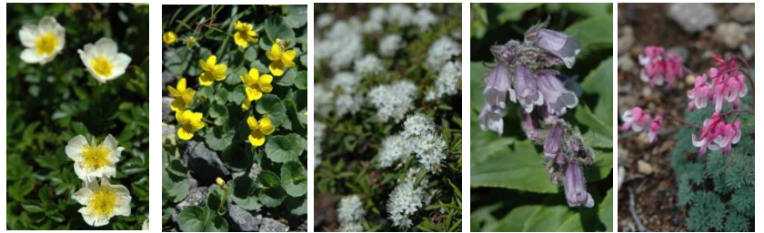
チングルマ タカネスミレ エゾイソツツジ イワブクロ コマクサ

【コマクサ平】コマクサ◎、イワブクロ○、タカネオミナエシ○【第3雪渓】ジンヨウキスミレ○【第4雪渓】キバナシャクナゲ◎、エゾコザクラ○、チングルマ○【山頂】タカネスミレ◎、タカネツメクサ○、メアカンキンバイ○、チョウノスケソウ↓