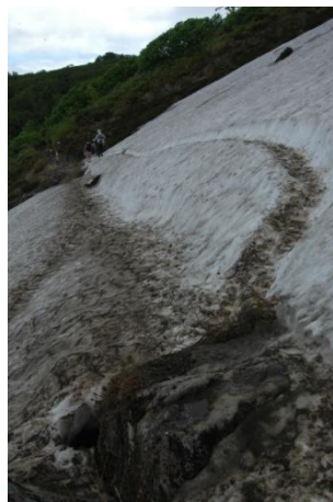
②第一花園看板周辺