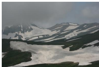
⑥ 緑岳山頂から旭岳方向