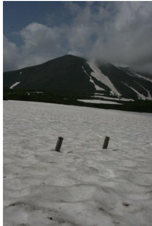
② 第一花畑看板付近