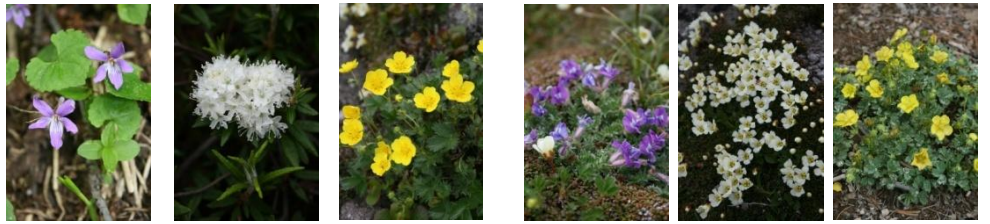
ミヤマスマイレ ヒメイツツジ ミヤマキンバイ オヤマノエンドウ イワウメ メアカンキンバイ

【花情報】登山口でダイセツヒナオトギリ○、樹林帯でミヤマスマイレ○、キバナノコマツメ○が咲いています。【ハイマツ帯】コケモモ○、ミヤマキンバイ○、メアカンキンバイ○、ヒメイツツジ○、【緑岳上部】イワウメ○、ミヤマキンバイ○、ミネズオウ○、【山頂周辺】イワウメ○、ミヤマキンバイ○、オヤマノエンドウ○、ホソバウルップソウ○