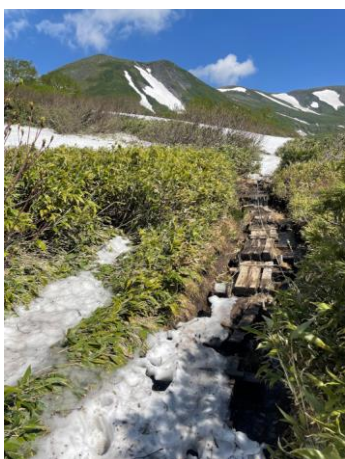
⑥柴山尾根乗越付近