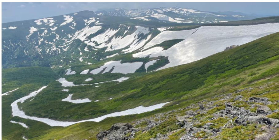
南沢上部より高根が原方面