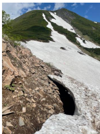
⑦エイコの沢ガレ場