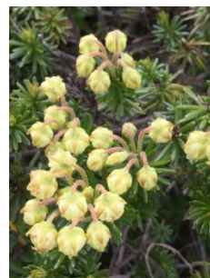
アオノツガザクラ