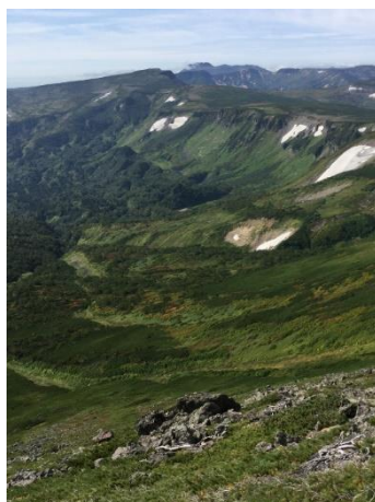
③岩塊斜面上部より俯瞰