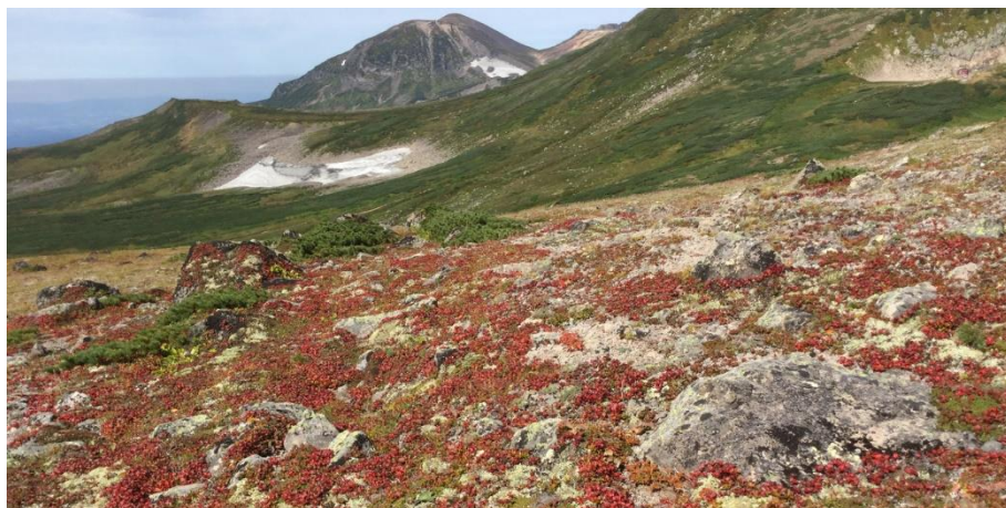
板垣分岐付近のウラシマツツジ紅葉