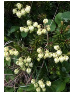
アオノツガザクラ