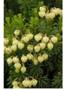
アオノツガザクラ