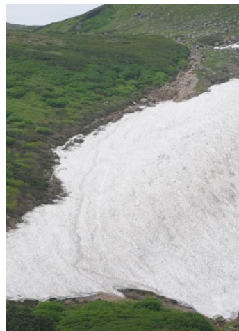
⑤第3雪渓登山道上の雪渓