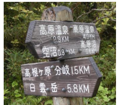
三笠新道分岐の標識

今年の高原沼巡りの紅葉は、暖かった昨年よりも更に遅れており、平年に比べ一週間以上遅れているようです。部分的に見頃の場所もありますが全体では3~4割程度でした。今後の天候に期待したいところです。