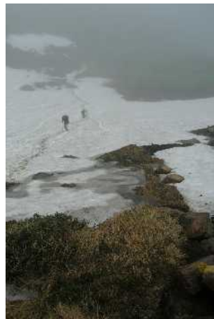
⑤第三雪渓中間部より俯瞰