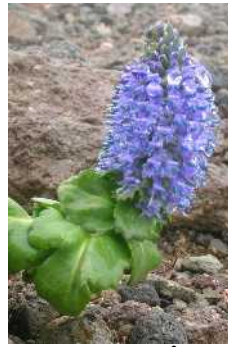
ホソバウルップソウ