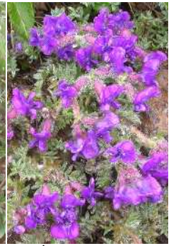
エゾオヤマノエンドウ