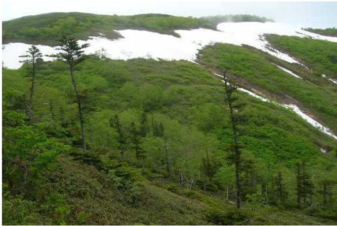
①第一花園斜面全景

コマクサ平:イワウメ↑ メアカンキンバイ↑ コマクサ(咲き始め) 赤岳周辺:イワウメ↑ ミネズオウ↑ タカネスミレ(咲き始め) 小泉平:エゾオヤマノエンドウ○ チシマアマナ↓ イワウメ↑ ホソバウルップソウ↑ ミヤマキンバイ↑ キバナシャクナゲ↑ エゾノハクサンイチゲ↑