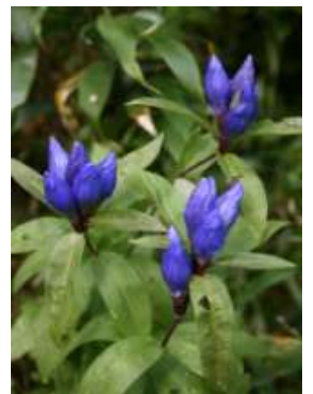
エゾオヤマノリンドウ

今年の高原沼巡りの紅葉 足踏み状態が長すぎます。滝見沼で5割の色づき、今後の天候に期待したいところです。今朝も高根が原上部まで、雪が下りてきています。