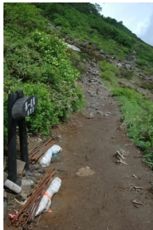
②第一花園看板周辺