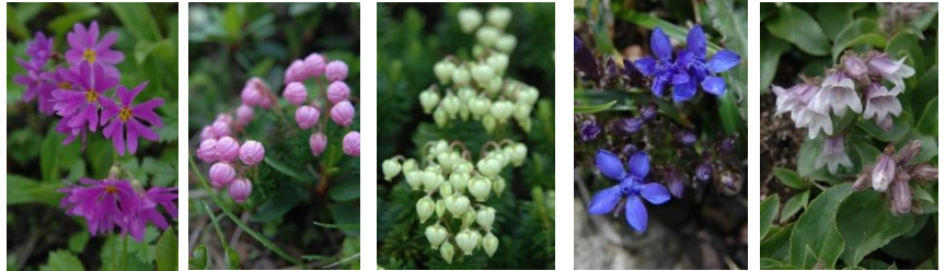
エゾコザクラ エゾノツガザクラ アオノツガザクラ リシリリンドウ イワブクロ

【第2花園～奥の平】ヨツバシオガマ○、エゾコザクラ○、キバナシャクナゲ○、アオノツガザクラ○【コマクサ平】コマクサ、イワブクロ○【第3～第4雪渓】キバナシャクナゲ○、エゾコザクラ○、チングルマ○【山頂】タカネツメクサ○、エゾツツジ○