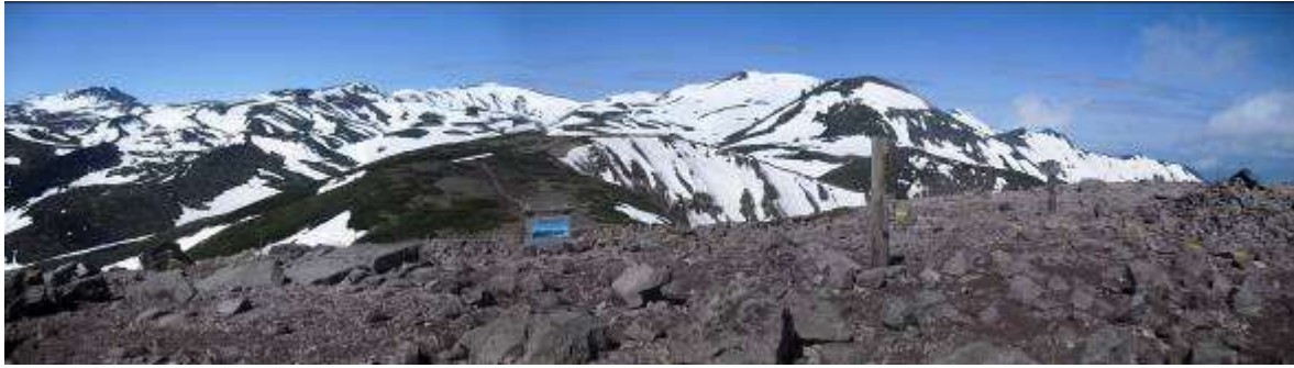
・6月7日 大雪の山々は風の強い稜線上以外はまだまだ雪の中です。今年は天候の影響で残雪が多いです。