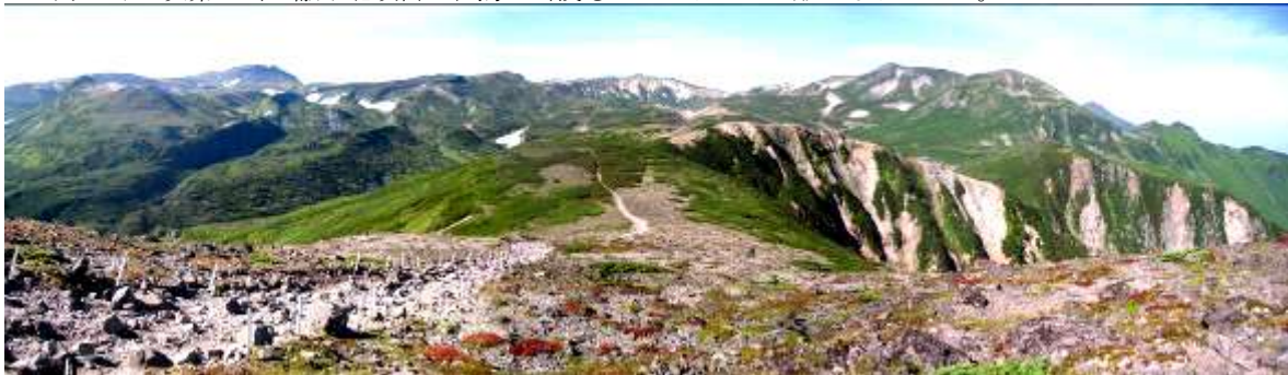
・8月29日 昨年と同様期に山頂周辺の「ウラシマツツジ」の紅葉が始まりました。