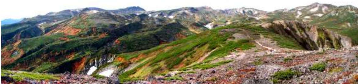
・9月20日 遅れていた紅葉も天候の影響で一気に深まり、結果的に昨年と同時期に見頃となりました。

☆ 全国自然いきものめぐりスタンプラリー ☆ 全国100ヶ所の国立公園・ビジターセンター等の館内の展示見学などをしてスタンプを集めて記念品をもらおう！ さらにそれぞれのビジターセンターで開催している「自然体験プログラム」に参加すると、ラリーにカウントできるシールがもらえます。ラリーシートは、全国のビジターセンターで配布中です。皆様のご参加お待ちしております♪ 期間は2013年3月まで。